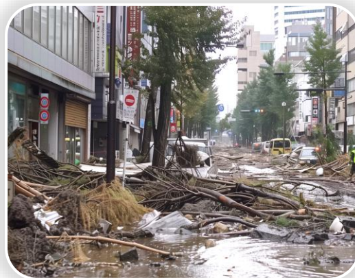
台風による損害状況

もし、この企業がパラメトリック台風保険を付保していれば、あらかじめ定義されたトリガーに基づき、迅速に、そのリスク・プロファイルに沿った保険金が支払われただろう。台風19号のような事象が発生し、右の地図に示すように、風速40 m/s以上の台風が、半径25kmを通過した場合、顧客は限度額の50%の保険金支払いを受けることができたであろう。このタイムリーで透明性の高い支払いにより、より迅速に操業を再開することができたはずである。